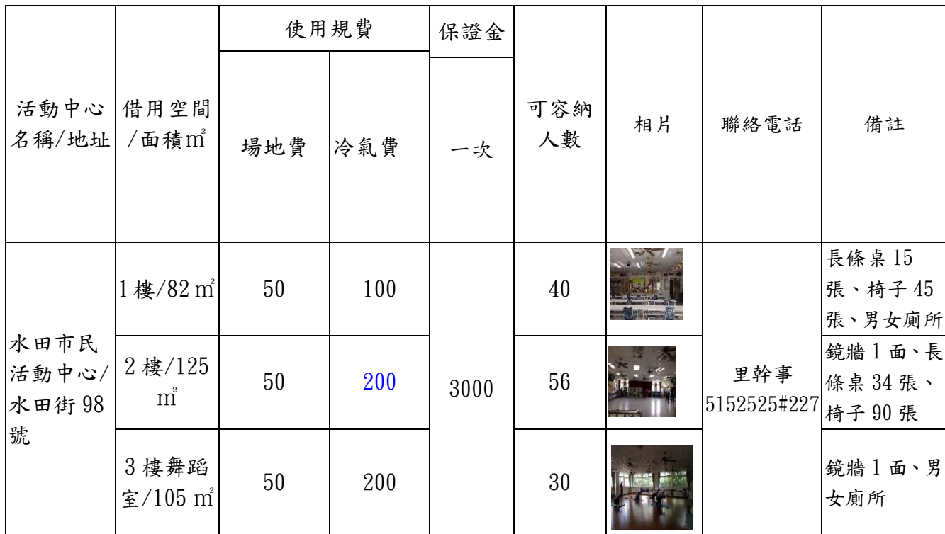
新竹市北區水田市民活動中心收費標準暨設備表(收費單位:元/小時)