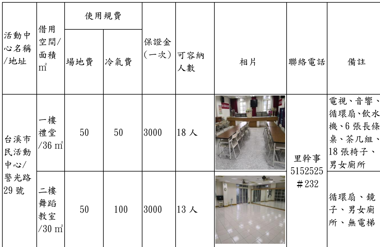
新竹市北區台溪市民活動中心收費標準暨設備表(收費單位:元/小時)