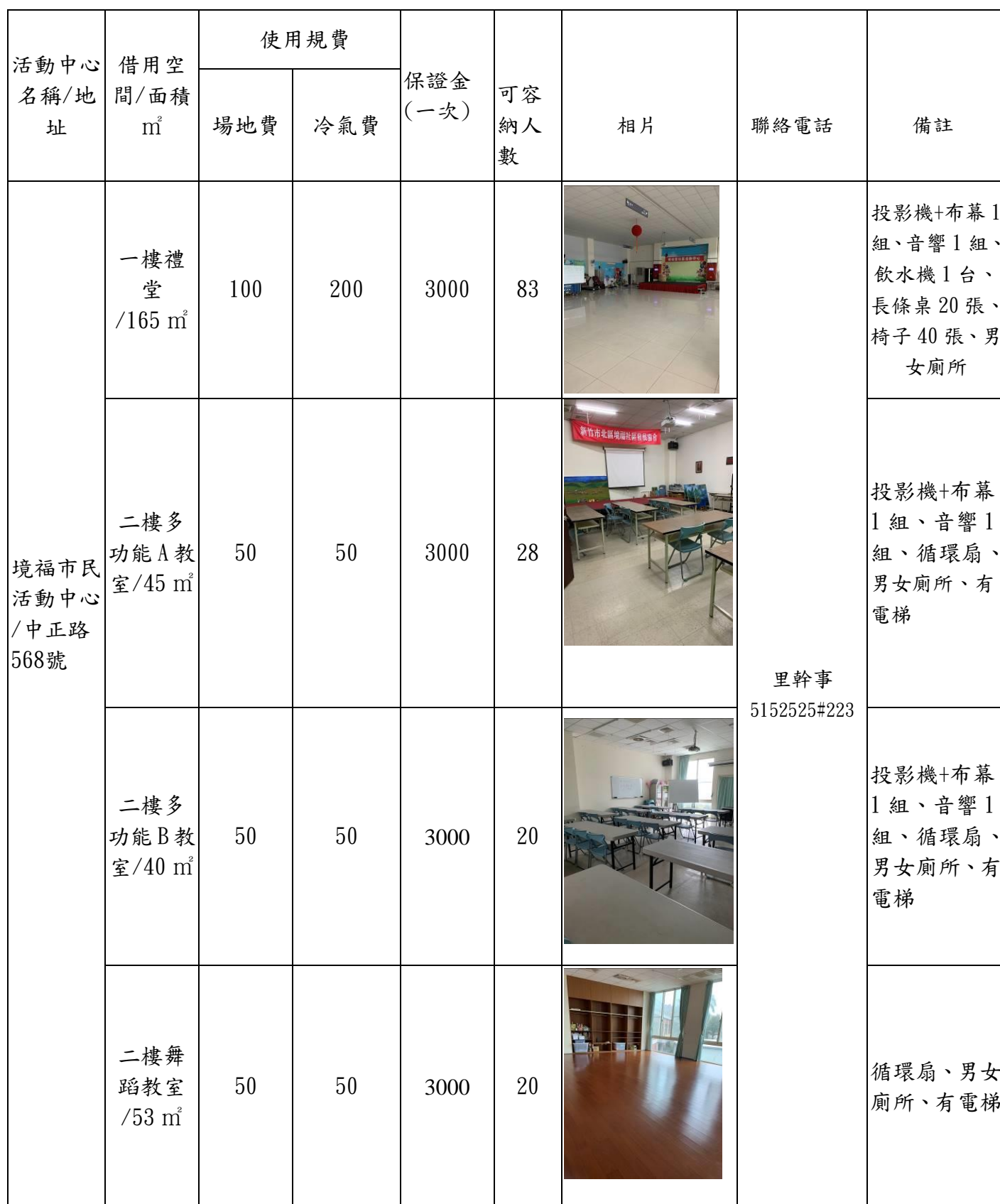
新竹市北區境福市民活動中心收費標準暨設備表(收費單位:元/小時)