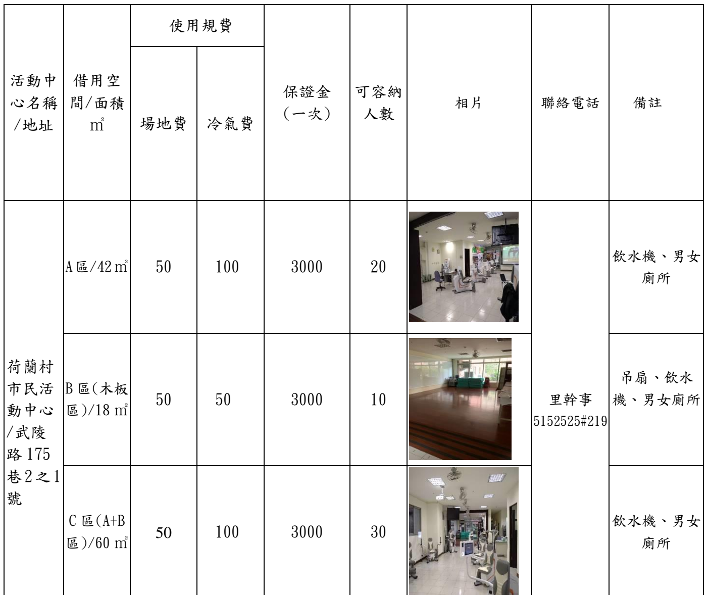
新竹市北區荷蘭村市民活動中心收費標準暨設備表(收費單位:元/小時)