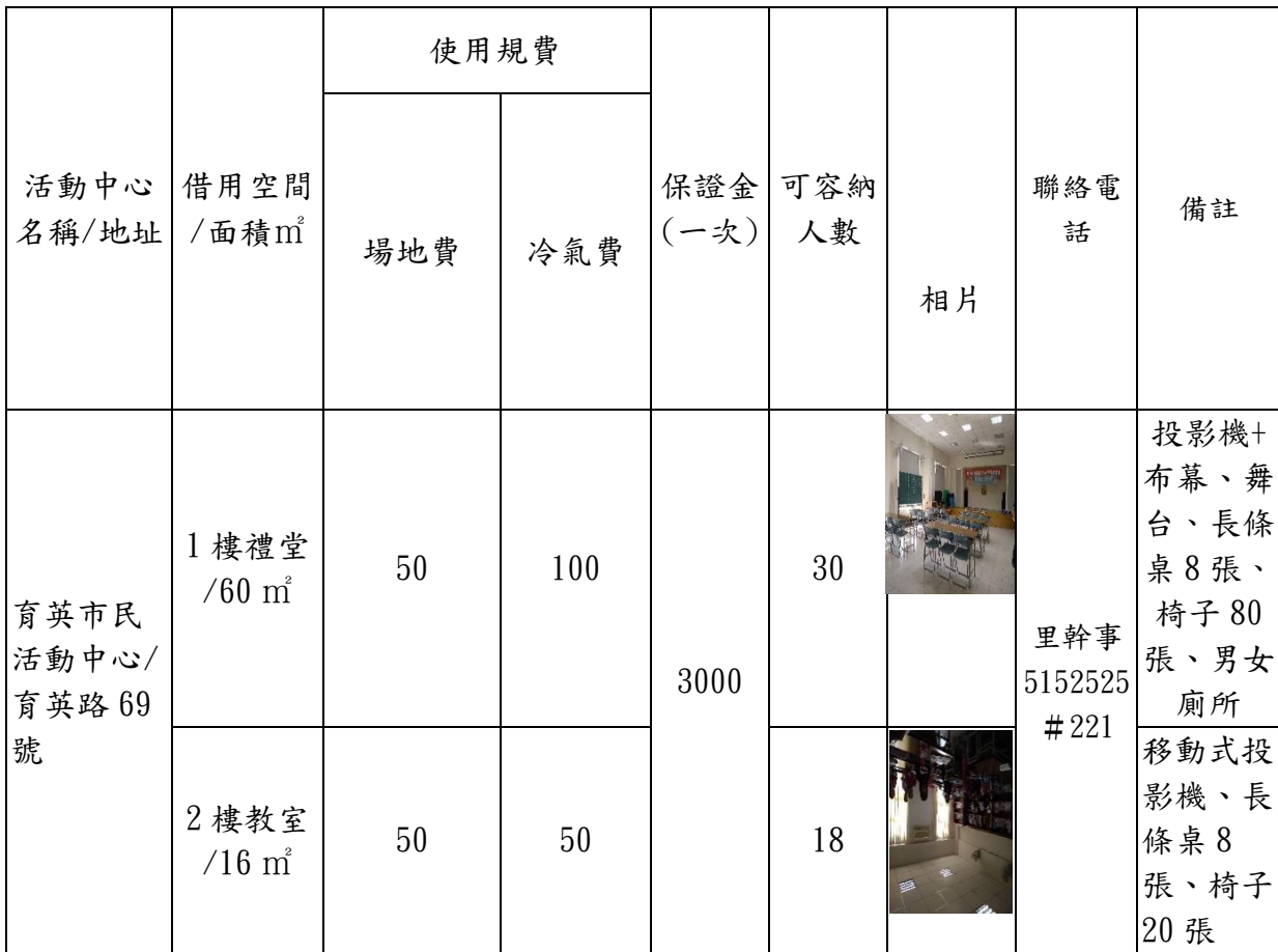
新竹市北區育英市民活動中心收費標準暨設備表(收費單位:元/小時)