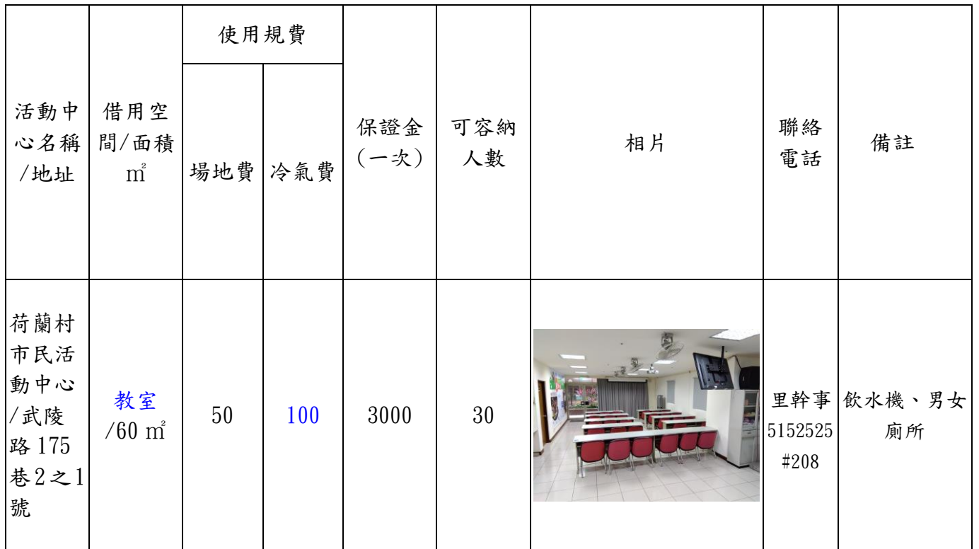
新竹市北區荷蘭村市民活動中心收費標準暨設備表(收費單位:元/小時)